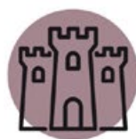
ZABYTKI I INNE BUDYNKI „Z WIDOKIEM”