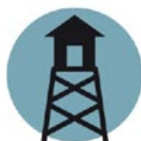
WIEŻE I PLATFORMY WIDOKOWE