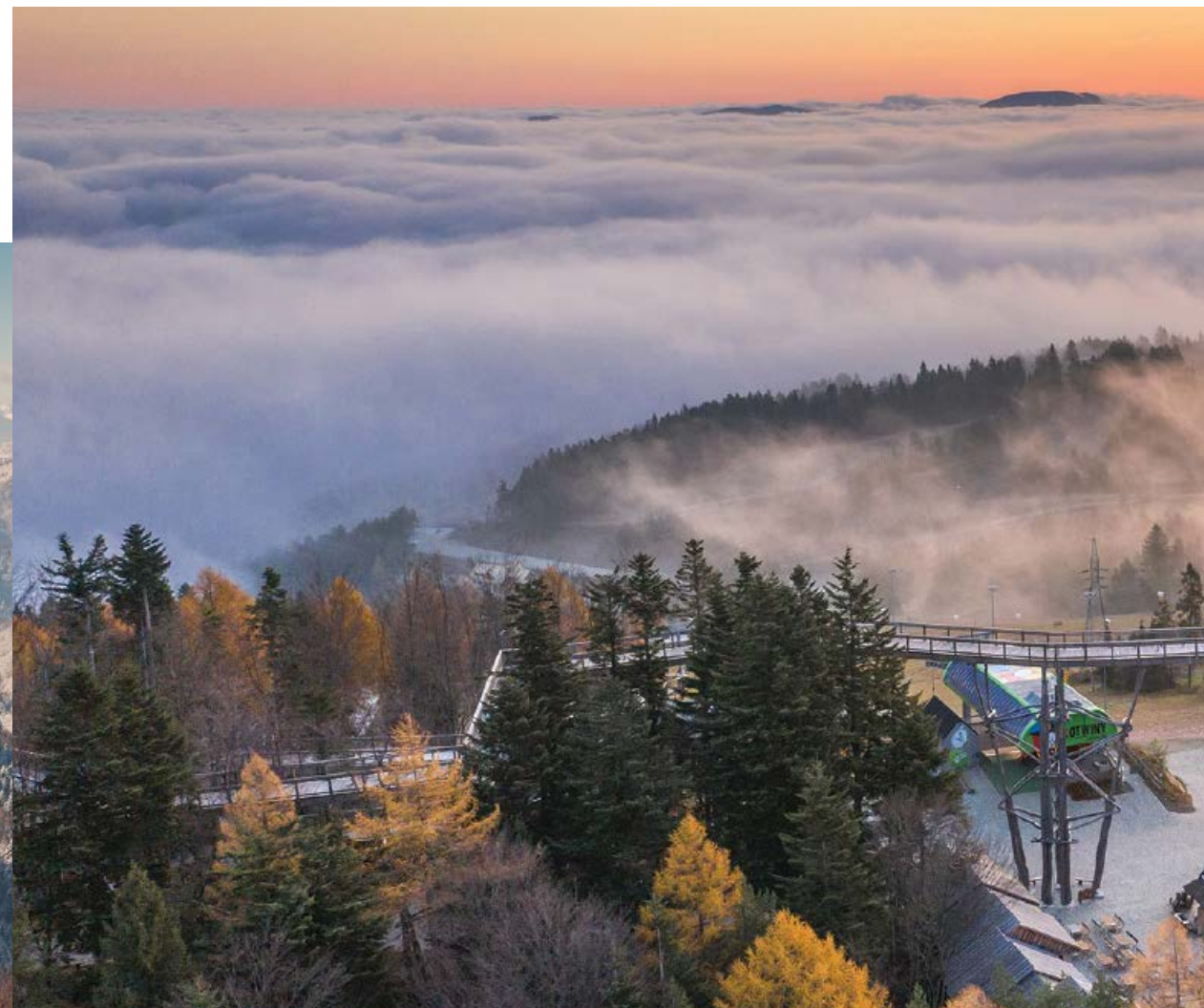
► Wieża widokowa w Krynicy-Zdroju Słotwinach

Dookolna panorama ze szczytu zaburzona jest nieco jego zabudową. Najlepszy płatny punkt widokowy znajduje się obecnie na dachu budynku górnej stacji kolei gondolowej, gdzie w wakacje 2021 r. otwarto najwyższą położoną w Krynicy platformę widokową (8 m ponad gruntem).